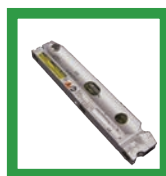
línea de tiza o laser