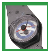
Llave de torsión con indicador de cuadrante