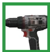
Pistola de grado industrial