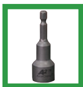
Conector hexagonal de 9/16 "y 7/16" y adaptador para pistola de tornillo