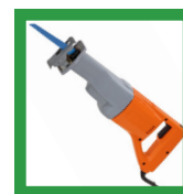
Sawzall para recortar el exceso de longitud del riel

(Vea las instrucciones paso a paso en el reverso).